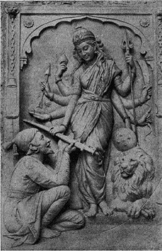
शिवाजी और भवानी ( कऱमरकरकी बनाई हुई मूर्ति )